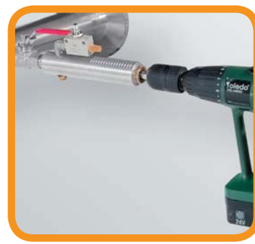
Anbohren unter Druck